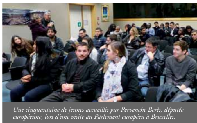
Une cinquantaine de jeunes accueillis par Pervenche Berès, députée européenne, lors d'une visite au Parlement européen à Bruxelles.

Ce mécanisme de consultation permanente vise à créer des passerelles entre jeunes et décideurs pour qu'ils conduisent une réflexion commune sur les priorités, la mise en œuvre et le suivi de la coopération européenne dans le domaine de la jeunesse. Sachons utiliser cette