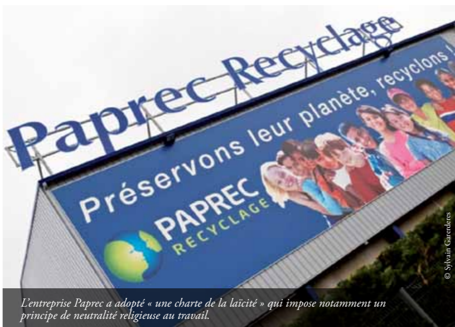
L'entreprise Paprec a adopté « une charte de la laïcité » qui impose notamment un principe de neutralité religieuse au travail.

L'arrêt du 24 juin 2014 revêt en outre une portée jurisprudentielle : le choix de la neutralité religieuse par une crèche, même privée , est légitime pour protéger la liberté de conscience des jeunes enfants et garantir aux parents le choix du mode d'éducation de leurs enfants. De ce fait, une loi protégeant